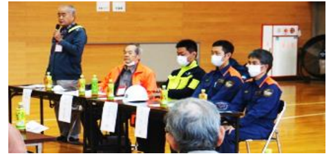
主催者及び訓練指導の皆様

自主防災会、地域づくり安全安心部会共催で、富士小学校アリーナにて開催。各町内から町会長はじめ町内の役員並びに町内担当の民生委員を交えての訓練とグループ討論会と致しました。30代から70代の幅広い年代層からご参加頂き、それぞれの立場や目線から防災意識を高める為の率直な意見交換を目的とし、短い時間ではありましたが