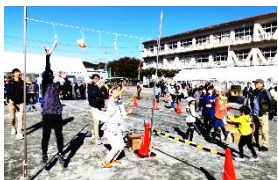
<ゲット・ザ・おやつ>