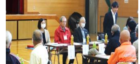
ご来賓の皆様 グループ討論の様様

グループ討論 36 町内会を8ブロックに分けて「訓練内容・町内の自主防災会・防災備蓄品」をテーマにリーダーが進行役を務めて約30分間の意見交換会を行い記録紙を提出しました。