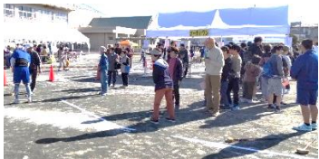
<ホール in ワン>