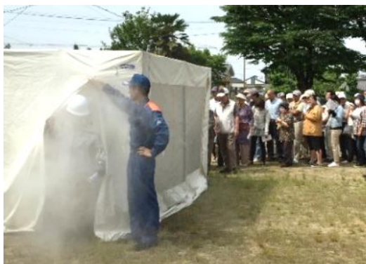
スモークハウス体験

前半は消防本部による防災訓話、スモークハウスを使つての煙の中を脱出する体験、消火器の使い方の訓練を行った。