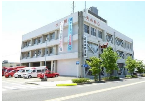
町内北西にある 消防本部

緑1町内会の北西には一宮消防本部がある。そこから東西に各1本、国道155号線から南へバス通りの1本北側までが区域である。