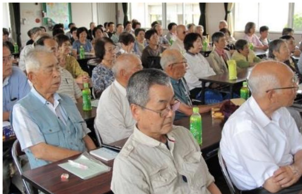
会場いっぱい の受講者

今後も、一層充実した有意義で楽しい教養講座になるよう努めていきます。皆様方多数のご参加をお待ちしています。